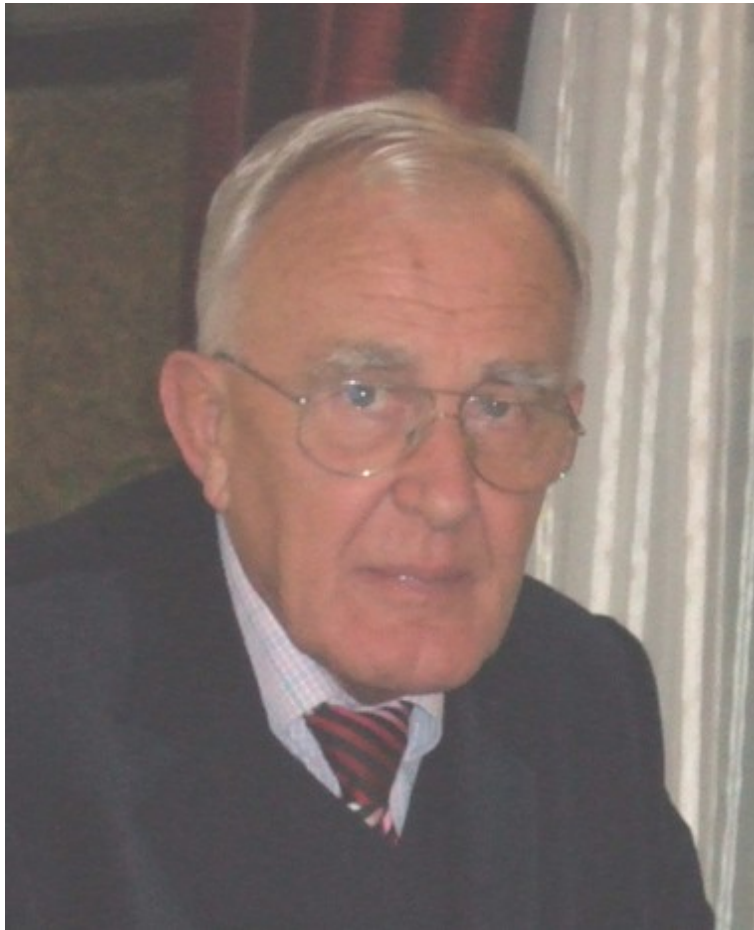
Slika 2: Zvonimir Janko (preuzeto iz [9]).

Hrvatski matematičar Zvonimir Janko, rođen je u Bjelovaru 1932. godine. Bavio se proučavanjem teorije konačnih grupa, a posebno se posvetio klasifikaciji konačnih jednostavnih grupa te 1964. godine dolazi do velikog otkrića - prve Jankove sporadične jednostavne grupe J_1 . To otkriće izazvalo je mnoga pitanja jer se smatralo da postoji samo pet Mathieuovih sporadičnih jednostavnih grupa. Došlo je do pitanja ima li sporadičnih grupa beskonačno mnogo te hoće li se ikada moći sve klasificirati. Tada je počelo istraživanje koje je trajalo oko 30 godina i na kojem je sudjelovalo više od 100 teoretičara grupa koji su na kraju dokazali potpunu klasifikaciju svih konačnih jednostavnih grupa, a dokaz je zahtjevao 10 000 stranica časopisa. Bio je to jedan od rijetkih ključnih matematičkih problema koji je do kraja riješen. Od 21 grupe koje su se otkrile nakon prve Jankove grupe, profesor Janko otkrio je četiri, to su J_1, J_2, J_3, J_4 .