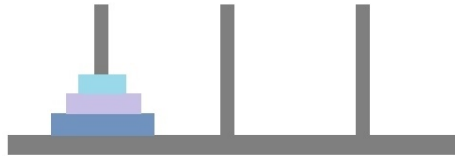
Slika 4.2: Toranj Hanoja u slučaju tri diska

Sada ćemo razriješiti slučaj s tri diska. Na početku su sva tri diska na prvoj igli kao na slici 4.2.